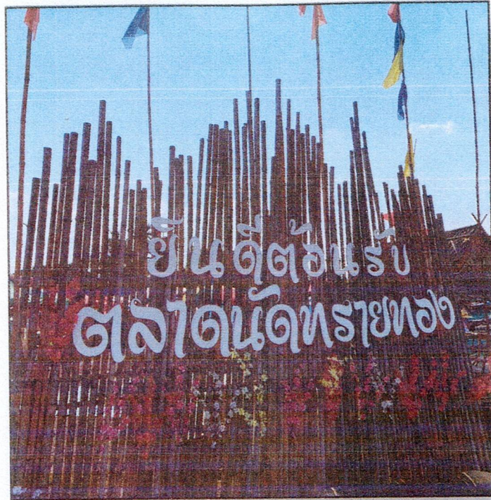
รูปภาพตลาดนัดหมู่บ้าน/ชุมชน ในเขต อปท. ตลาดนัดทรายทอง หมู่ที่ ๑ ต.แก่งดินสอ อ.นาดี จ.ปราจีนบุรี