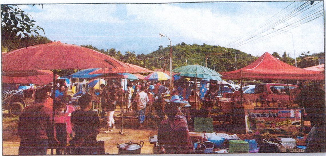
รูปภาพตลาดนัดหมู่บ้าน/ชุมชน ในเขต อปท. ตลาดนัดบ้านเขาขาด หมู่ที่ ๗ ต.แก่งดินสอ อ.นาดี จ.ปราจีนบุรี