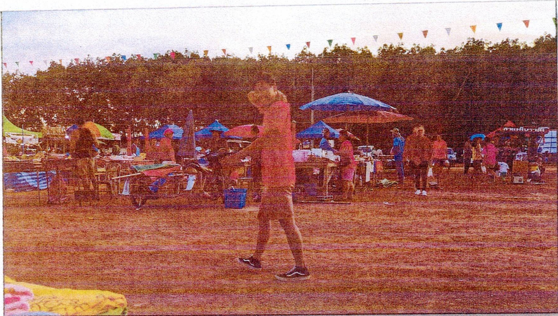
รูปภาพตลาดนัดหมู่บ้าน/ชุมชน ในเขต อ.ปท. ตลาดนัดตลาดนัดริมอ่างเก็บน้ำห้วยโสมง หมู่ที่ ๘ ต.แก่งดินสอ อ.นาดี จ.ปราจีนบุรี