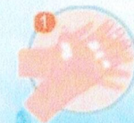
ฝ่ามือถูฝ่ามือ