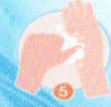
นิ้วหัวแม่มือ ถูรอบตัวฝ่ามือ