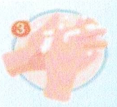
ฝ่ามือถูฝ่ามือ และนิ้วถูข้อมือ