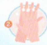
ฝ่ามือถูหลังฝ่ามือ และถูข้อมือ