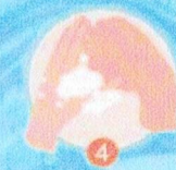
หลังมือถูหลังมือ