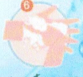
ข้อมือถูข้อมือ ฝ่ามือ